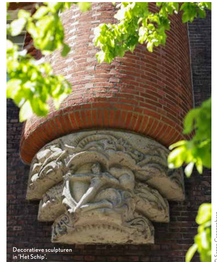
Decoratieve sculpturen in 'Het Schip'.