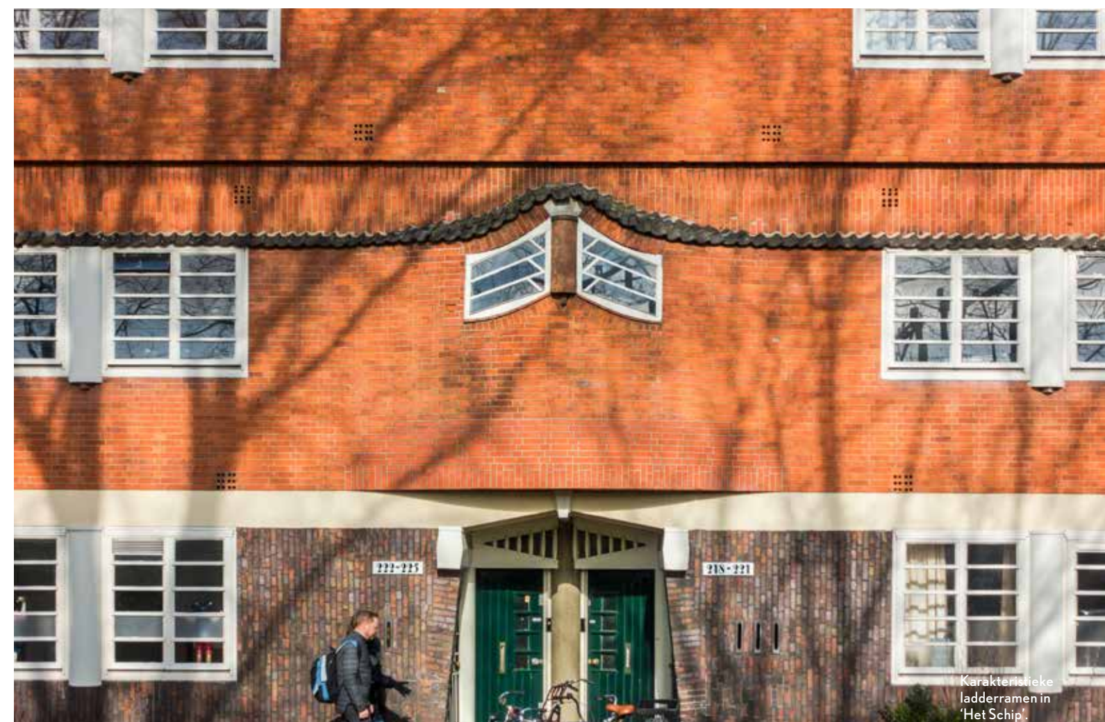
Karakteristieke ladderramen in 'Het Schip'.