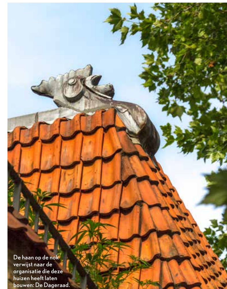
De haan op de nok verwijst naar de organisatie die deze huizen heeft laten bouwen: De Dageraad.

Het strenge, intimiderende karakter van een bergwand aan baksteen wordt verzacht door sierlijke welvingen. Nooit geweten dat bakstenen kunnen swingen