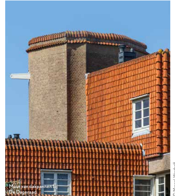
Muur van dakpannen bij De Dageraad.

De huizen die De Klerk in de jaren 1914-1921 in opdracht van woningcorporatie Eigen Haard aan het Spaarndammerplantsoen liet bouwen werden ‘paleisjes voor arbeiders’ genoemd. Ze zien er inderdaad aanmerkelijk luxueuzer uit dan >